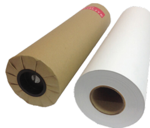
กระดาษขาวพล็อตแบบ ระบบเลเซอร์