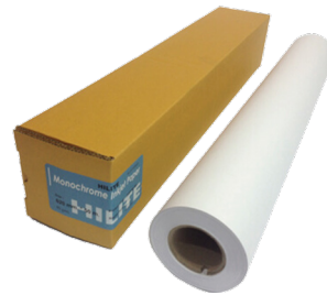
กระดาษขาวพล็อตแบบ ระบบอิงเจ็ต