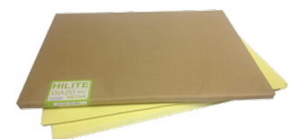
กระดาษพิมพ์เขียวไร้กลิ่น