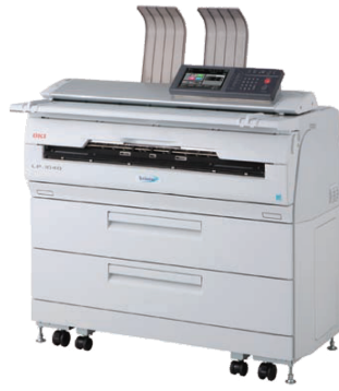
Teriostar 1040 ซีรี่