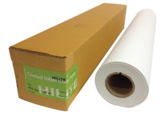
กระดาษอิงเจ็ตเคลือบ พิเศษ